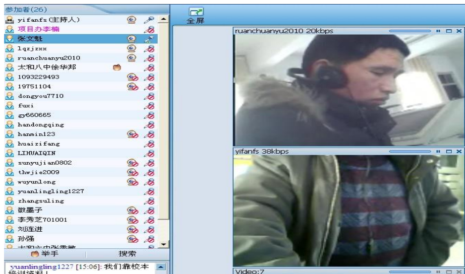
1月14日，阜阳数学3班借助安徽省中小学教师教育网视频会议室进行线下集中研讨截图

全程。我们随时给予及时的引导和支持服务，当个别学员跑题或者发言内容杂乱无序或冷场等情况出现时，提醒主持人要及时加以引导，通过提问等形式引导主题研讨的逐步深入。这种新颖的研修方式强烈地吸引了学员的注意力，调动了学员的研修积极性，既弥补文字表达的临场感不足，从而提升学习者的沟通投入程度，又丰富了网络表达，更好地引发了学员对情境材料的深层解读和讨论。