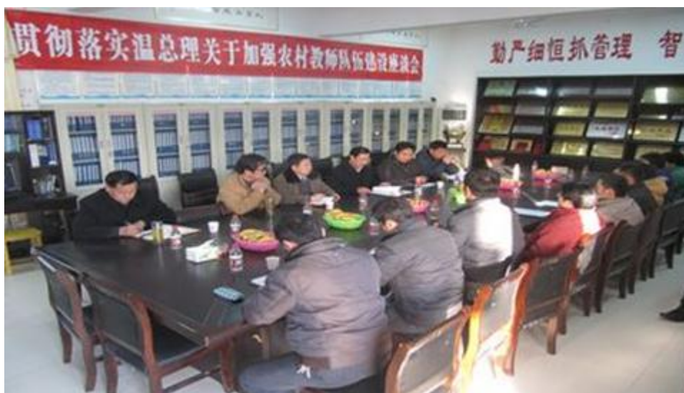
图为项目办领导及专家与亳州市谯城区大杨中学领导和教师们座谈